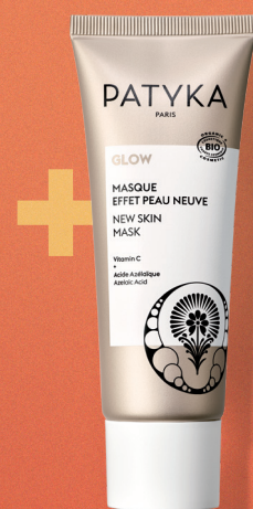
La Maschera 1 o 2 volte a settimana