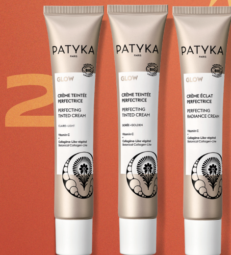
La Crema (chiara, dorata o non colorata)